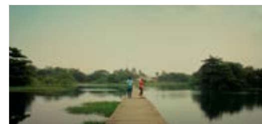
All the Colours of the World Are Between Black and White

Golem 22:30 - Mutt + corto previo Confussion in the Afternoon