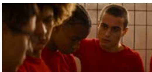
Le paradis (The Lost Boys)