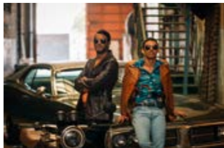
La huella de unos labios

Golem 22:30 - La huella de unos labios + corto previo Son pardos