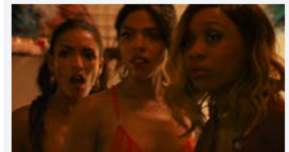
À mon seul désir

Jueves 23- 18:30- Sesión de cortometrajes (Monte, Las mechitas, Deus Não Deixa, Acmé)