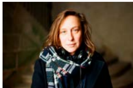
Céline Sciamma Premio de Honor Festival LesGaiCineMad 2023

PROYECTO CHUECO C/ Barbieri 18 Metro Chueca Entrada libre hasta completar aforo